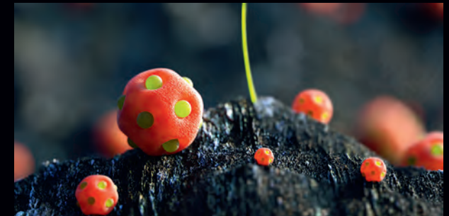
Dented Appearance