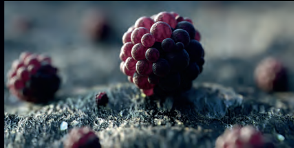
Blueberry Bubbles

INTEL. DESIGN. 3D-ANIMATION. VIDEO & POST.